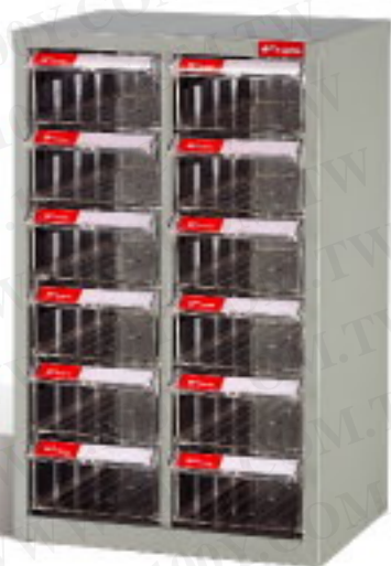
A6-212H (142-1) 362Wx265Dx571Hmm

勝特力材料 886-3-5753170 勝特力電子(上海) 86-21-54151736 勝特力電子(深圳) 86-755-83298787 Http://www.100y.com.tw