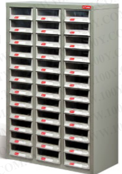
A5-336 (141-5) 586Wx290Dx937Hmm