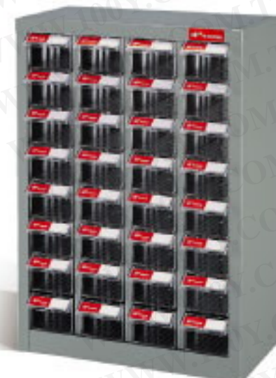
A8-432 (143-4) 466Wx222Dx642Hmm