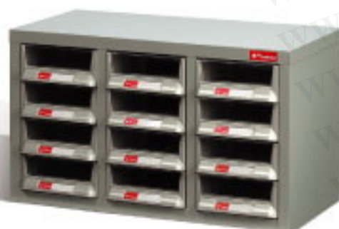
A5-312 (141-3) 586Wx290Dx350Hmm

抽屜採「抽取式」透明視察，辨識管理更為便利。 內附透明隔板，空間靈活運用多變化。 採鋁鋼耐重軌道。