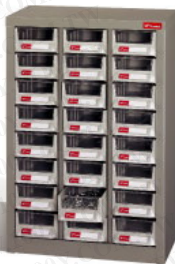
A7-324 (142-10) 444Wx222Dx642Hmm