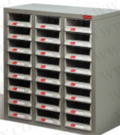
A5-324 (141-4) 586Wx290Dx640Hmm