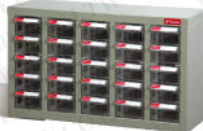
ST1-525 (143-10) 586Wx222Dx350Hmm