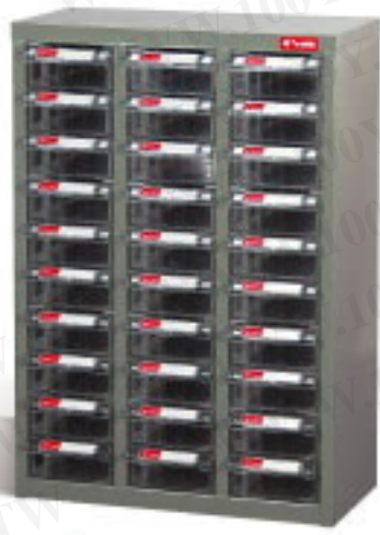
ST2-330 (143-15) 444Wx222Dx642Hmm