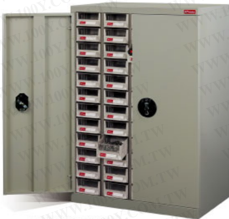
■ 對開式附鎖加門設計 A7-448D (加門型)