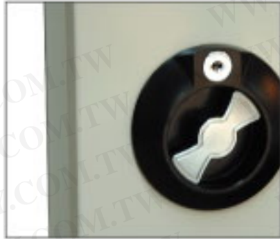
對開式附鎖加門設計 對開門較不佔使用空間，開門使用更便利。

零件櫃系列產品有高低抽設計，種類和規格皆齊全，特殊的滑軌設計，拉抽更為順暢，辦公、工廠都適用。 材質：鍍鋅鋼板 抽屜：GPS/透明抽屜 ABS/耐油抽屜