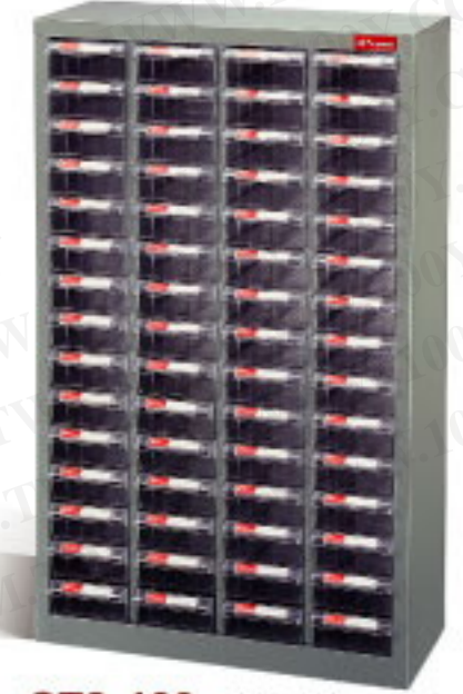
ST2-460 (143-16) 586Wx222Dx937Hmm