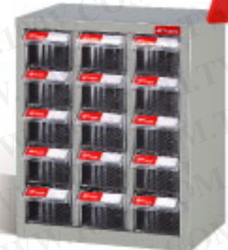
A8-315 (143-3) 355Wx222Dx415Hmm