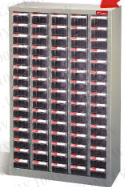
ST1-575 (143-12) 586Wx222Dx937Hmm