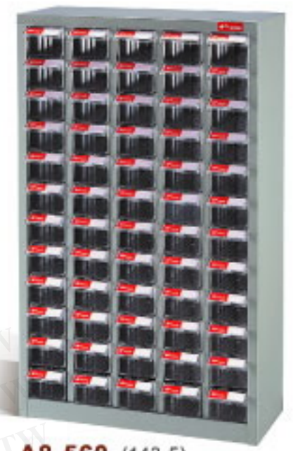
A8-560 (143-5) 586Wx222Dx937Hmm