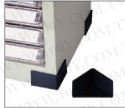
護套 三腳護套貼心設計，讓使用者更方便安全。(隨櫃附贈)