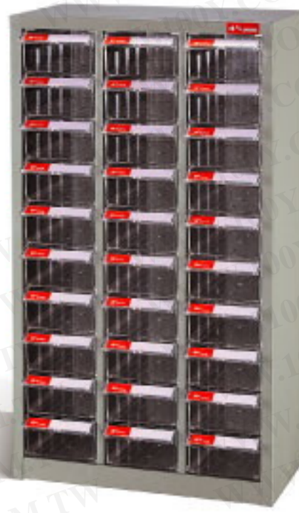
A6-330H (142-3) 533Wx264Dx937Hmm