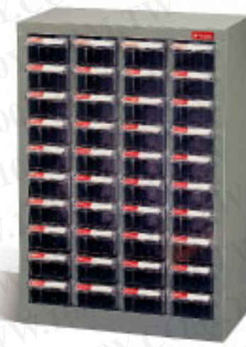
ST1-440 (143-11) 466Wx222Dx642Hmm