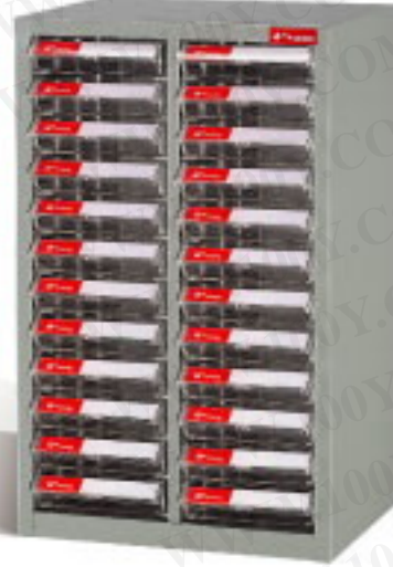
A6-224P (142-2) 362Wx265Dx571Hmm