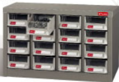
A7-416 (142-9) 586Wx222Dx350Hmm

抽屜採「抽取式」透明視窗， 辨識管理更為便利。 內附透明隔板，空間靈活 運用多變化。 採塑膠耐重軌道。