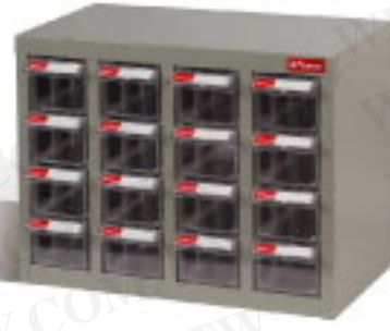
A8-416 (143-1) 466Wx222Dx350Hmm