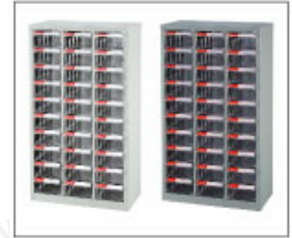
本體 規格色：灰色 特殊色：白色 (10台以上接單生產) 材質：鍍鋅鋼板0.7mm 粉體塗裝0.1mm 厚度：0.8mm