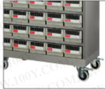
活動座 任何落地型零件櫃，均可加裝活動底座。 活動輪前兩只煞車裝置，可隨時將零件櫃固定在適當的位置。