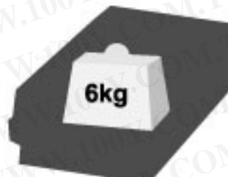
* 超耐重抽屜設計 每個抽屜可乘載約 6kg

抽屜採「抽取式」透明視察，辨識管理更為便利。 內附透明隔板，空間靈活運用多變化。 採鋁鋼耐重軌道。